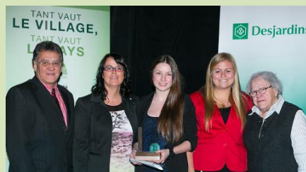
Lauréat du second prix (10 000$) : Partenaires 12-18 : Des raccrocheurs de rêve, des réveilleurs de leaders du Centre-du-Québec