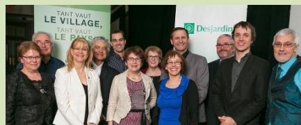
Grand lauréat (25 000$) : Petit-Saguenay 2020

Parmi 151 projets soumis, le Mouvement Desjardins et Solidarité rurale du Québec ont remis trois prix à des projets d'initiative citoyenne.