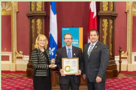
Solidarité rurale du Québec a remis le prix Organisme rural de l'année à la Saint-Isidore-de-Clifton en Action.