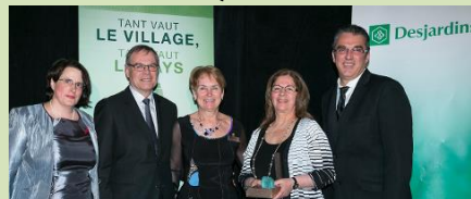
Lauréat du troisième prix (5 000$) : La P'tite école de Lac-Édouard